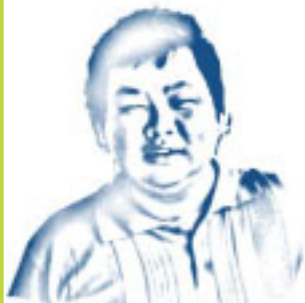
por: Edgar Egawa

PARA AQUELES que leram o nº58 do Fala Meu! (edição de dezembro de 2007) e participaram da promoção para obter a camiseta, ou não, muitos devem ter se perguntado em que língua foi redigida a frase. O título deste artigo já entrega o ouro, mas os leitores têm noção do que seja este idioma, e qual sua relação com a Doutrina Espírita?