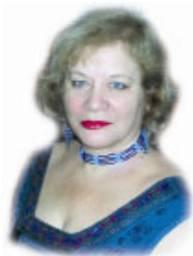
por: Cristina H. Saraf

SEGUNDO Kardec, projeto 1868, alguns pontos deveriam ser pacíficos entre os espíritas: os Princípios que o constituem. Alterar isto é descharacterizá-lo.