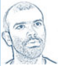
por: Joelson Pessoa