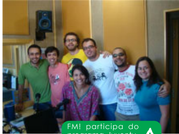
FM! participa do programa Juventude Maior na Rádio Boa Nova

SEM sombra de dúvidas, os meios de comunicação são poderosas ferramentas para a divulgação em massa de informações; não há como negar, por exemplo, o poder que a TV tem de influenciar as pessoas, assim como a internet com suas propagandas, sites, e-mails, vídeos, chats, etc, bem como os jornais, revistas, revistas eletrônicas (como o FM!) e as estações de rádio. Tamanha é a influência da mídia, que alguns religiosos chegam a proibir seus adeptos de assistirem TV; em São Paulo a um tempo atrás, na marginal do rio Tietê, uma igreja chegou a colocar num grande outdoor a seguinte frase : "A televisão é a imagem da Besta".