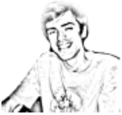
por: Rodrigo Prado