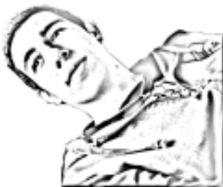
por: Leandro Soares

DE acordo com a resolução CONAMA 306:2002: " Meio Ambiente é o conjunto de condições, leis, influência e interações de ordem física, química, biológica, social, cultural e urbanística; que permite, abriga e rege a vida em todas as suas formas".