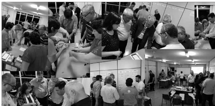
Foto 1: Oficina focada em trabalho colaborativo