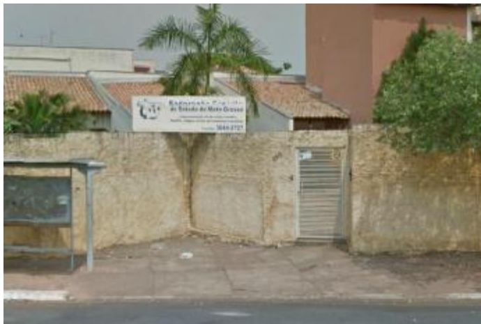
Fachada da sede da Federação espírita do Estado de Mato Grosso – 2011