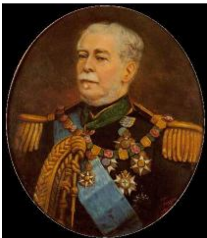
Luiz Alves de Lima e Silva (Duque de Caxias)