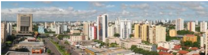
Vista panorâmica de Cuiabá - 2012