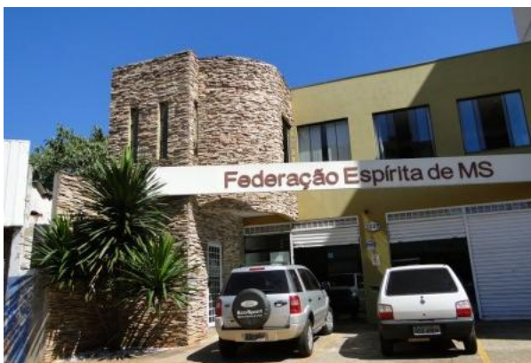
Federação Espírita do Mato Grosso do Sul

Graças à Providência Divina e ao amparo da espiritualidade pude vencer com paciência os problemas que surgiram, sem me desanimar. As lutas da FEB me serviram de estímulo. O que sofreram os confrades da Federação Espírita Brasileira, no início da sua organização, não foi fácil; a incompreensão, a ação dos inimigos da luz, que se prevaleciam das falhas dos imprudentes, causavam o desequilíbrio da organização iniciante. Chegou ao ponto de quase soçobrar o navio em alto-mar.