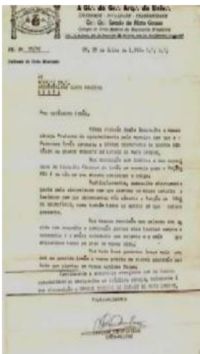
Fac-símile da carta do Grão-Mestre Constantino

códigos evangélicos. Uma vez que a maçonaria se reveste de quase todas as características do Cristianismo, nada era obstáculo para continuar frequentando-a. Cumprir o meu dever assumido com a ordem maçônica é demonstração da minha vivência cristã.”