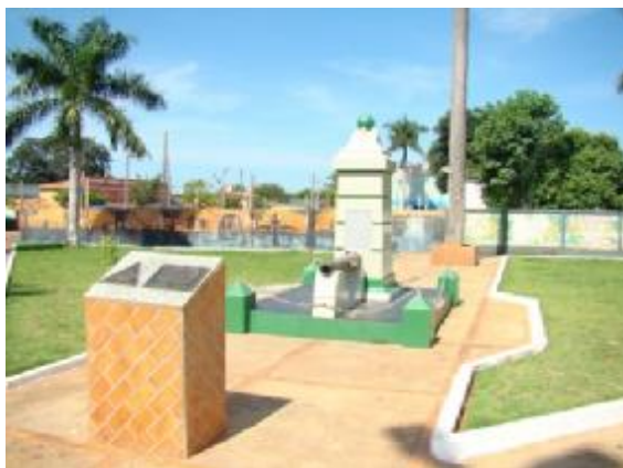
Praça em Nioaque/MS – 2011

visto que a filha do Prefeito, desencarnada há algum tempo, se manifestou; o que determinou uma postura mais entusiástica do Chefe da cidade. Essa proximidade entre eles estabeleceu um movimento intenso para a fundação do Centro Espírita Nioaquense.