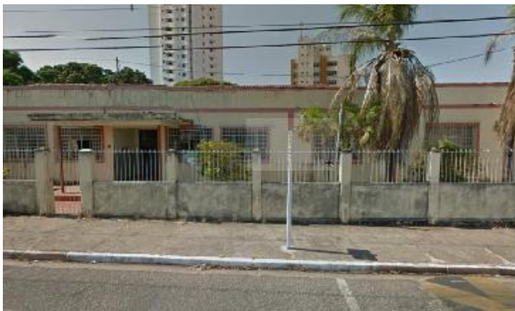
Lar Espirita Monteiro Lobato 1998