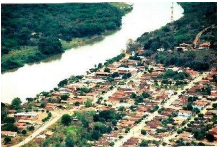
Vista aérea de Barão de Melgaço/MT - 2011

Entre os anos de 1915 e 1920, às margens do Rio Cuiabá, na localidade onde Augusto de Leverger, o “Barão de Melgaço”, organizou a defesa contra a invasão do Paraguai, que intentava ocupar as terras de Mato Grosso, foi-se consolidando a pequena vila, hoje cidade de Barão de Melgaço.