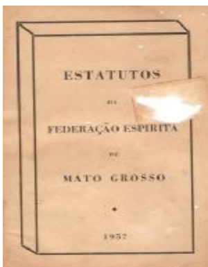
Fac-símile da capa original dos Estatutos da FEEMT

O nosso querido Brasil é a terra da Promissão, a terra do Cruzeiro, coração do Mundo, a Pátria do Evangelho, e Mato Grosso, como parte integrante dessa imensa Pátria, não podia ficar indiferente, de braços cruzados, diante de tão nobre missão consagrada ao Brasil. Cristianizando o povo, educando-o, combatendo os vícios, a ociosidade e a mentira estaremos cumprindo o sagrado dever para com a família, com a Pátria e para com Deus.