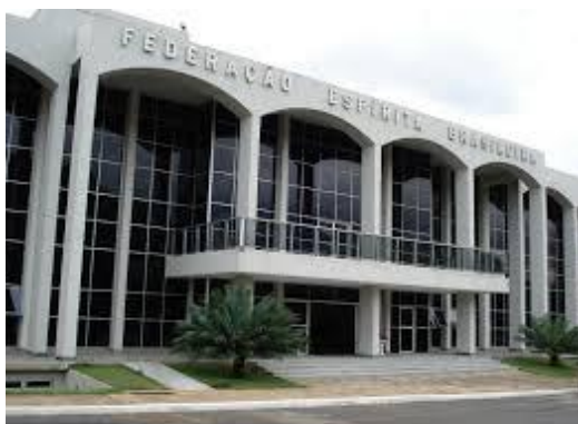
Fachada do prédio da Federação Espírita Brasileira em Brasília