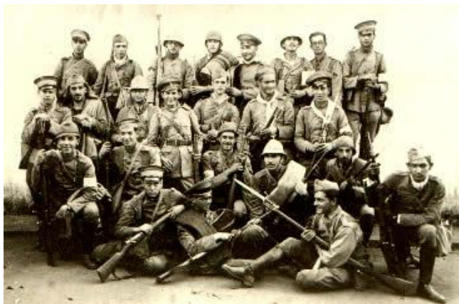
Um grupo de paulistas participante da Revolução Constitucionalista de 1932.

Quando Vargas assumiu poder em 1930 pela Junta Militar que destituiu o presidente Washington Luís, manteve sob rédeas a autonomia de São Paulo, indicando um Interventor de fora do Estado. Alguns não se conformavam com o fato de São Paulo estar sendo comandada por um “interventor forasteiro”.