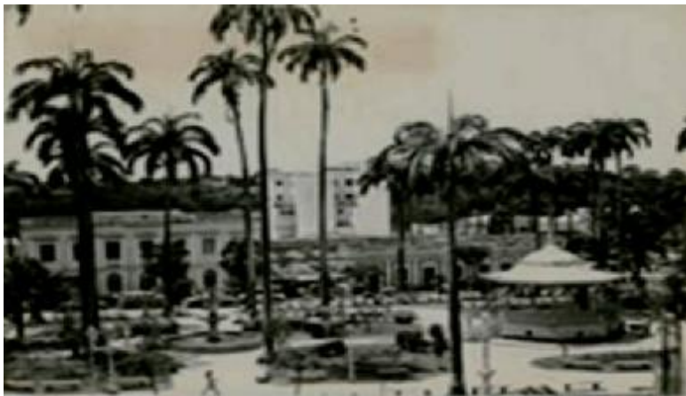
Cuiabá em 1919