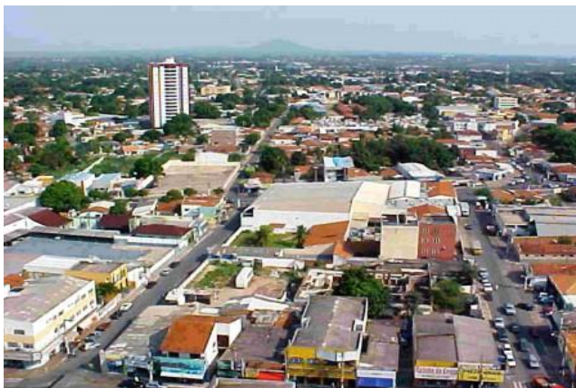
Vista panorâmica de Várzea Grande – 2012

Enquanto Secretário da Prefeitura, também difundiu os postulados espíritas na cidade, e todos que o sabiam espírita, procuravam-lhe a consolação e não foram raras as vezes em que teve que ministrar passes, esclarecer e ofertar remédios homeopáticos.