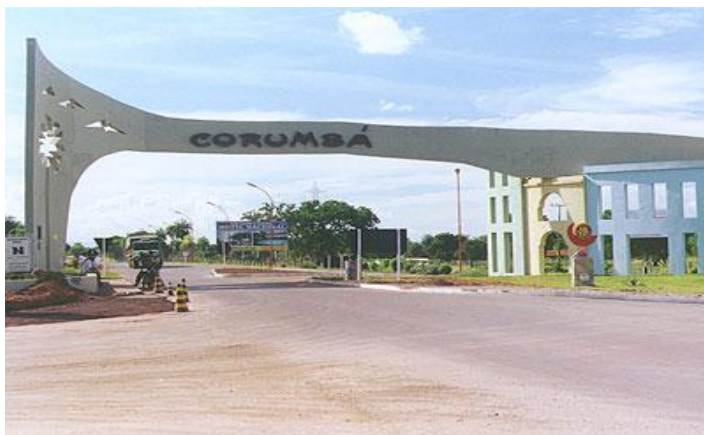
Portal de Corumbá, a cidade branca - 2012