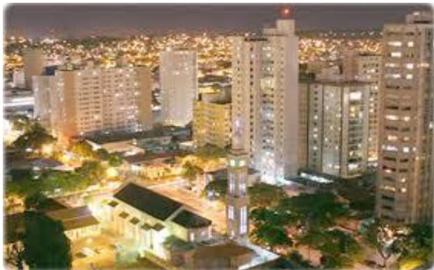
Campo Grande/Mato Grosso do Sul - 2012

Daí por diante tornaram-se grandes amigos. Constantino detalhou-lhe a panorâmica doutrinária campo-grandense. Na cidade, morava um casal de idosos cuja filha era médium de acentuada sensibilidade e decidiram visitá-los. Estabeleceu-se desse contato inicial uma forte amizade entre eles e, a partir desses vínculos, o casal foi convidado para realizar sessões mediúnicas, em que aconteceram algumas comunicações interessantes e confortadoras, porquanto estimuladoras.