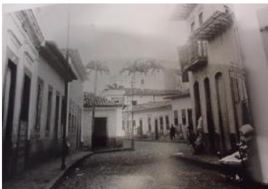
Formação dos primeiros processos administrativos da Vila Real do Senhor Bom Jesus de Cuiabá.

Depois, rumou para Fortaleza e daí para Sergipe, para onde fora designado para comandar o 28° B.C., isto em 1924. Sua atividade em Aracaju foi muito grande, com conferências, artigos em jornais, visitas etc., animando sobremaneira o meio espírita aracajuano. Como comandante, tornou-se bastante querido, do soldado raso ao oficial superior. Em 1926, adoeceu gravemente, ficando resolvido seu recolhimento ao Hospital São Sebastião, em Salvador, quando as suas forças não mais lhe permitiam levantar-se do leito.