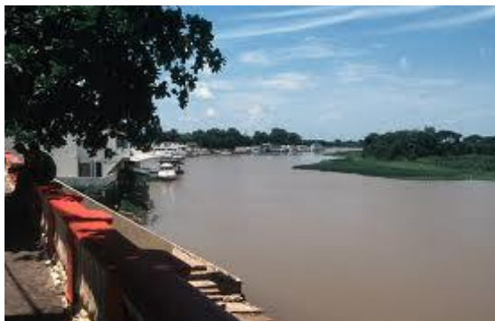
Porto no Rio Paraguai – Cáceres – MT – 2011