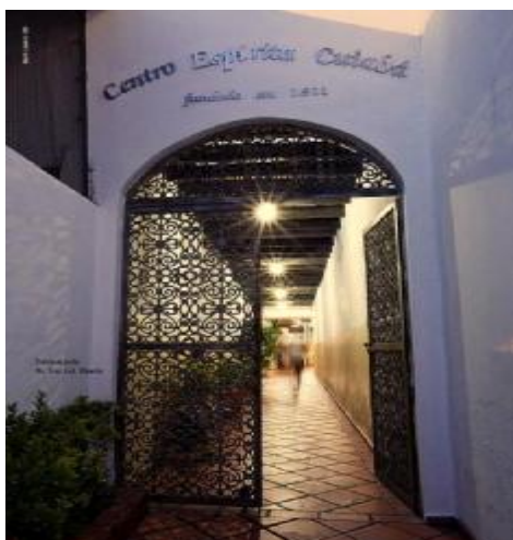
Entrada do C.E. Cuiabá - 2011