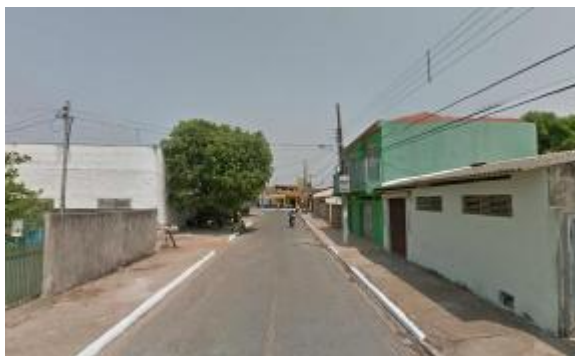
Logradouro localizado no Bairro Praeiro, foto de 2011

Registramos, também, que um dos lotes doados foi reservado para a construção do Centro Espírita José Antônio dos Reis, outro destinado para a construção de uma igreja protestante e mais um terceiro lote foi cedido para a igreja católica, que, contudo não se interessou em ocupá-lo.